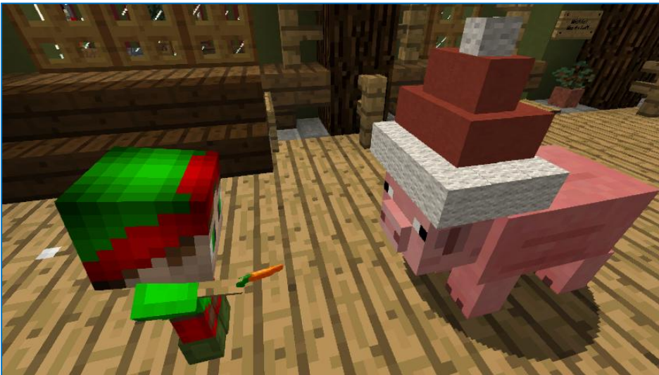
Ein Weihnachtsschwein mit Wichtel

Mit ein bisschen Übung lassen sich so die detailliertesten Dekorationselemente zaubern. Hier ein paar Beispiele aus unserer Wichtelwerkstatt: