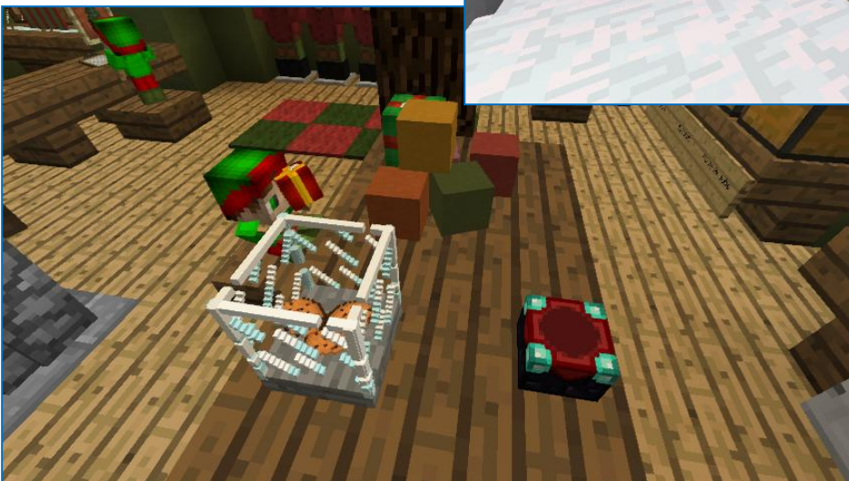
Eine Keksdose mit ande- ren Spielereien auf dem Tisch