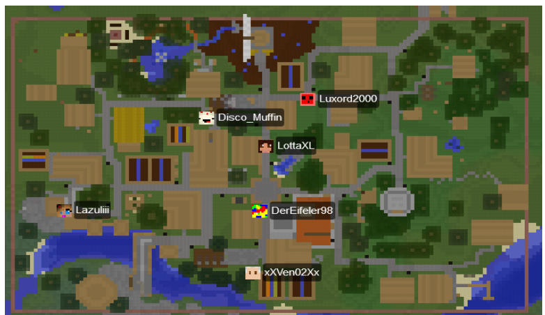
Das große Suchen im Dorf