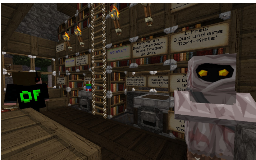
Der kleine Buchladen von dem aus Rallye und Suchspiel starten

Sowohl Rallye als auch Suchspiel laufen noch bis Freitag, den 1. August 23:59 Uhr.