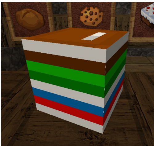
Einer der gesuchten Bücherstapel

Für jede richtige Antwort gibt es einen Deko-Bücherstapel frei Haus.