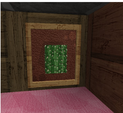
Dieser Kaktus im Schrank einer unbekanntenen Person ist zur Zeit sehr gefragt.

Sie startet im Buchladen des Dorfes. Der ist vom Eingang aus ausgeschildert. Man bekommt ein Buch mit Fragen, die man direkt im Buch beantworten muss. Die Antworten findet man – wie nicht anders erwartet – natürlich irgendwo in Etnaria. Ist man fertig, signiert man das Buch und wirft es in den bereitgestellten Trichter.