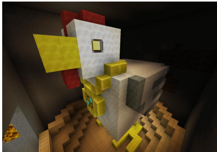
Helga junior in ihrem Höhlennest