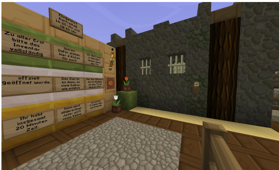
Noch ist es geschlossen, das Dorf .....