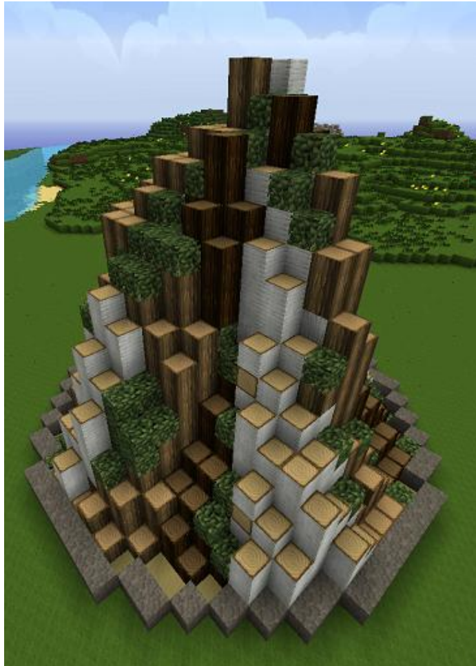
Bald wird es angezündet.

angezündet. Die Osterwiese findet ihr südlich von London ( /warp osterwiese ). Da haben wir eine Bitte: Das Feuer brennt hier ab. Damit uns nicht so schnell das Feuer ausgeht, könnt ihr Holz in jeder Form spenden. Dann können wir immer nachlegen. Spendenkisten stehen bereit.