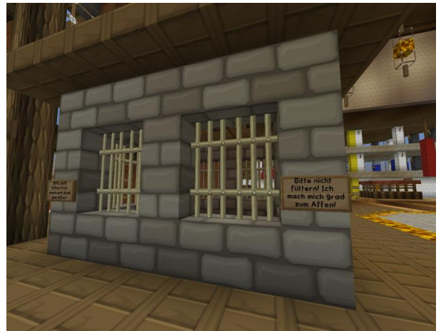
.... ab in den Affenkäfig!

Ebenfalls höchst verdächtig war das komische Biom, das ich im Abbau entdeckt hatte.