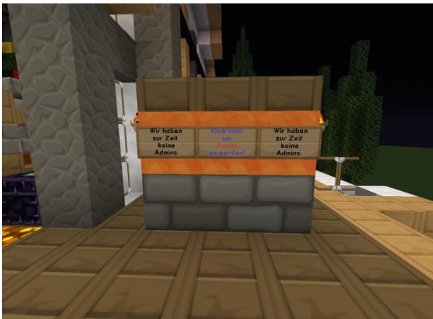
Ein Klick und .....

Einige von euch wurden von uns ja ordentlich in den April geschickt. Es gab doch ein paar, die wirklich gerne Admin werden wollten und sich dann aber im Affenkäfig wiederfanden.