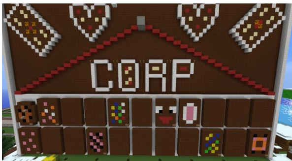
die Kekswand am Knusperhaus