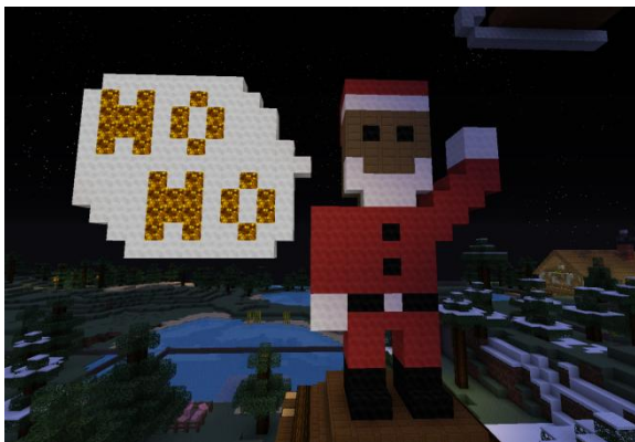
GS von Feeee12 – Idyllica 3 /home LottaXL:zwei

Beide gewinnen je 6 Diamanten, 1 'Weihnachtskiste' und eine goldene Kerze vor ihren GSen für den Rest der Weihnachtszeit.