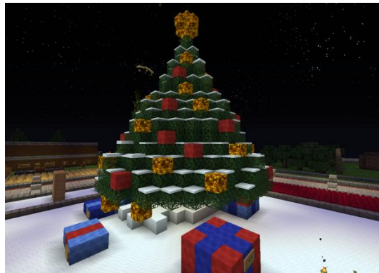
GS von Jillyane Corp-City /home LottaXL:eins

Sie gewinnt 4 Diamanten, 1 'Weihnachtskiste' und eine silberne Kerze vor ihrem GS für den Rest der Weihnachtszeit.