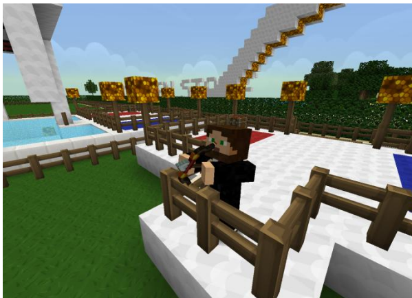
Nightcrall beim Lampenschießen

Das Ziel: Es gab 13 Lampen, die man treffen und aktivieren konnte. Dazu hatte man 15 Pfeile und einen Bogen. Es gab kein Zeitlimit. Dieses Spiel konnte wieder Lotta für sich entscheiden