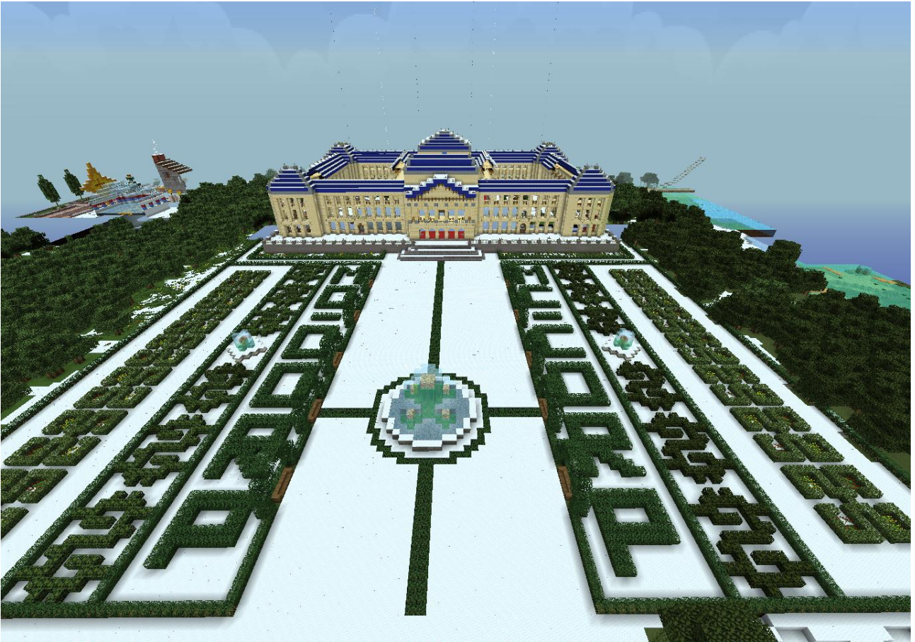
der verschneite Königspalast /warp königspalast