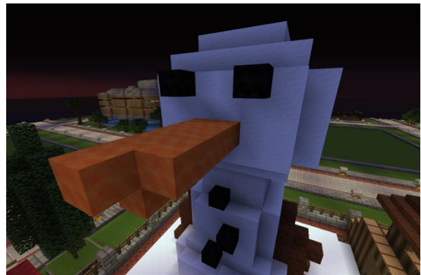
GS von Dailga – Corp-City 13 /home LottaXL:drei