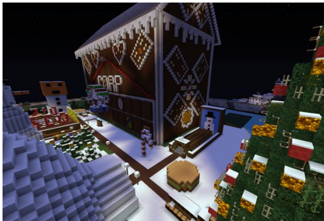
Der Weihnachtsmarkt /warp xmas

Es habe sicher schon alle mitbekommen: Es weihnachtet sehr auf Corp. Der Spawn ist weihnachtlich geschmückt und als Highlight erklingt dort sogar Weihnachtsmusik (Dank an kikel) und lädt zum Verweilen ein.