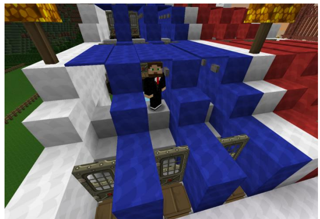
Nightcrall im Hindernisparcour