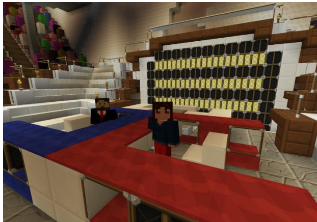
LottaXL und Nightcrall im Buzzerbereich

Auch dieses Spiel konnte Nightcrall knapp mit 5:4 für sich entscheiden.