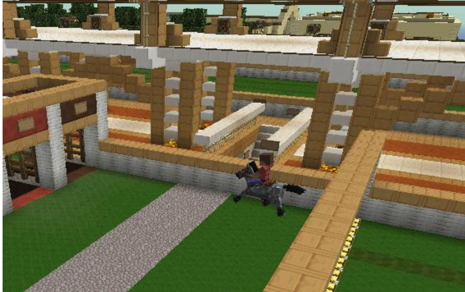
Zieleinlauf von kikelkik