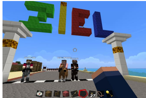
Die Sieger des 2. Rennens

Samstag 12.10. Ritt um 10 000 CT 14:30 Uhr