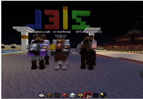
Die Sieger des 1. Rennens