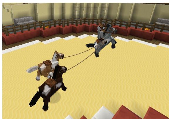
nick_kinimod1998 in Action

Die Jury, bestehend aus Nightcrall und LottaXL, hatte es nicht leicht. Bei allen drei ersten Plätzen gab es Gleichstände. Da alle so engagiert bei der Sache waren, hat die Jury auf ein Stechen verzichtet und dementsprechend mehr Preise vergeben.