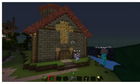
die Kirche des schönen Cow

Ebenfalls bekannt sind seine manchmal verschrobenen Ansichten von politischen Themen. Das führt dann manchmal zwischen Cow und Lotta zu lustigen Spielchen: