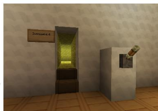
Gesicherter Eingang der Gummizelle

In der Psychologie arbeiten zum Wohle des Patienten drei kompetente Ärzte. Je nach schwere des Falles finden sich diese eventuell in weichen geräumigen Zimmern wieder.