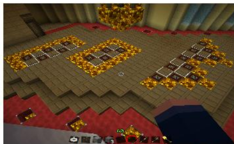
Cow-Disco im Palmen-Spawn-Gebäude