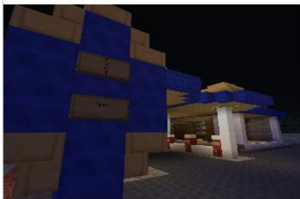
Cows Tankstelle im Industriegebiet

Außerdem hat er den Hang, sich überall zu verewigen. Hier ein paar Beispiele: