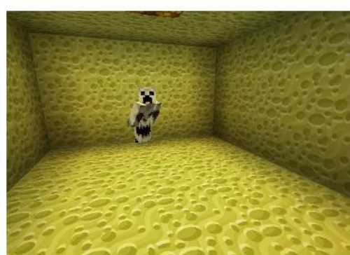
Patient Affenmaul in der Gummizelle

Auch, wenn es euch gut geht – schaut ruhig mal vorbei in Kikels Krankenhaus.