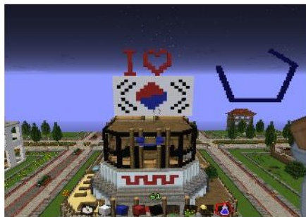
von Lotta an Cow

Ebenfalls bekannt sind seine manchmal verschrobenen Ansichten von politischen Themen. Das führt dann manchmal zwischen Cow und Lotta zu lustigen Spielchen: