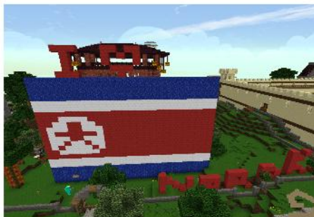
von Cow an Lotta

Trotzdem haben wir ihn alle lieb. Deshalb wollen wir seinen Geburtstag auch feiern. Es wird eine spontane Dropparty werden. Sammelt also alle schon einmal überflüssige und nutzlose Items (es gibt Gerüchte, dass er gerne verrottetes Fleisch ist). Die Party findet im Mine-Park an dem Cow-Jump-and-Run statt. Cowslayer89 hat am 17. August Geburtstag. Sobald er danach on ist und genügend Member da sind, gebe ich das Signal. Dann wird er dort von uns 'beschenkt'.