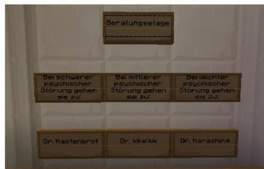
Die Ärzte in der Psychologie

In der Psychologie arbeiten zum Wohle des Patienten drei kompetente Ärzte. Je nach schwere des Falles finden sich diese eventuell in weichen geräumigen Zimmern wieder.