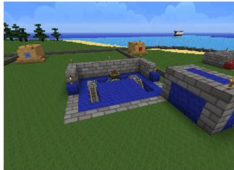
Aufgabe 3 und 2

Zum Glück waren alle Schützen schnell genug und konnten sich Aufgabe 2 zuwenden. Die begann wieder mit einem Holzknopf. Diesmal wurde ein Kisten-Minecart frei gesetzt. Dieses flitzte über einen kleinen Schienenweg und musste ebenfalls abgeschossen werden.